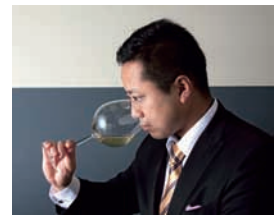
ブルゴーニュグラス